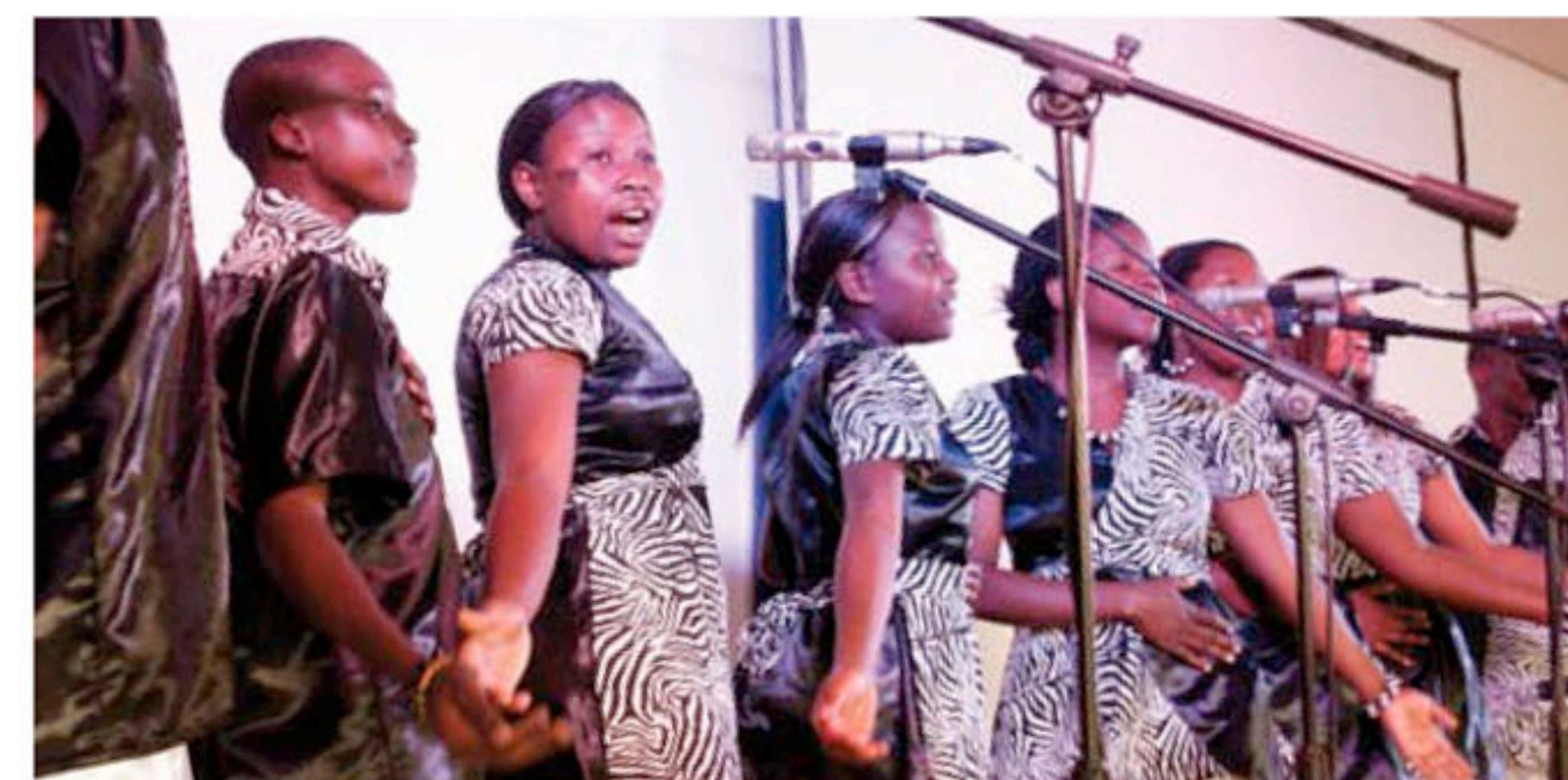
Die stimmungsvollen Sängerinnen und Sänger der „Global Voices“ aus Uganda setzten dem Event seine musikalische Krone auf. Zu den Highlights zählte ihre Interpretation der offiziellen Hymne zur Fußballweltmeisterschaft in Südafrika.