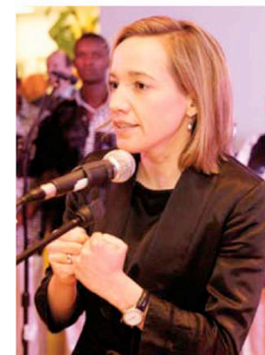
Ministerin Dr. Kristina Schröder: „Der Brunnenbau richtet sich nicht nur gegen Krankheiten, sondern fördert auch die Bildung!“