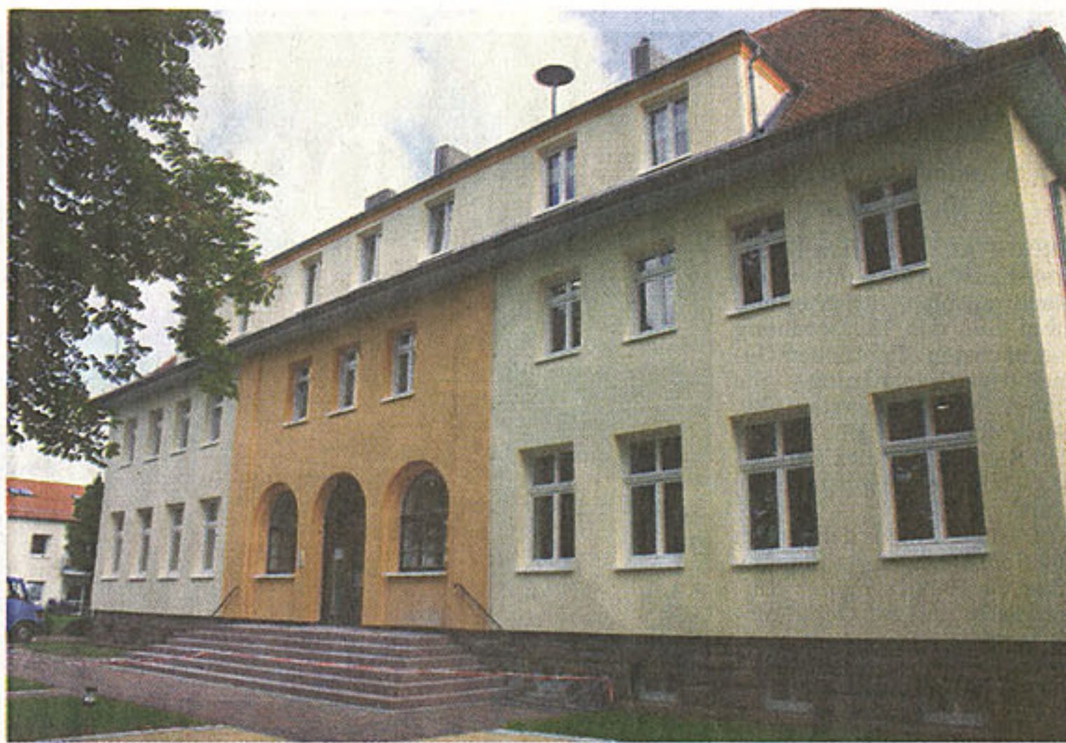
Leuchtende Farbtöne: So präsentiert sich die neue Fassade.