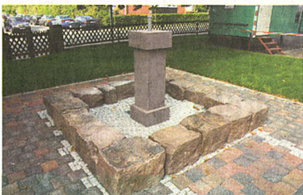
In Anlehnung an frühere Zeiten entstand auf dem Vorplatz des Kastanienhofs dieser besonders gelungene Brunnen.