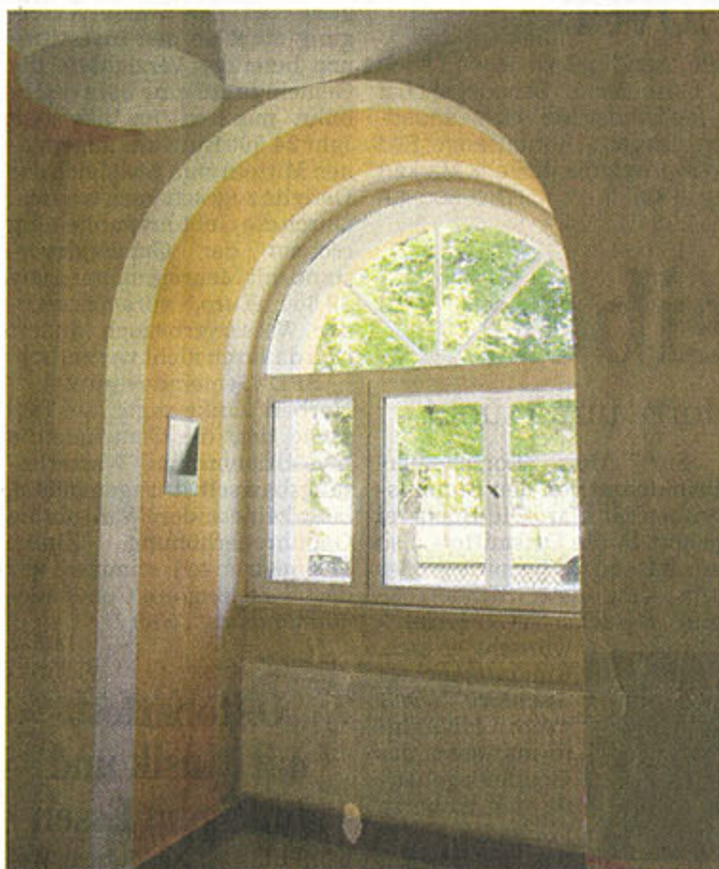
Gute Aussichten: Besonderer Blickfang ist der liebevoll gestaltete Eingangsflur mit seinen Rundbögen.

Am Samstag ab 14 Uhr findet das mittlerweile traditionelle Sommerfest mit buntem Treiben statt. Für das leibliche Wohl wird wie immer bestens gesorgt sein. Die Vorstellung der Tagespflege und des Gemeindetreffs erfolgt am Sonntag um 15 Uhr. In gemütlicher Atmosphäre bei Kaffee und Kuchen erhalten die Besucher detaillierte Informationen über die aktuellen Angebote. Weitere Angebotswünsche oder Vorschläge seitens der Gäste sind dabei herzlich willkommen.