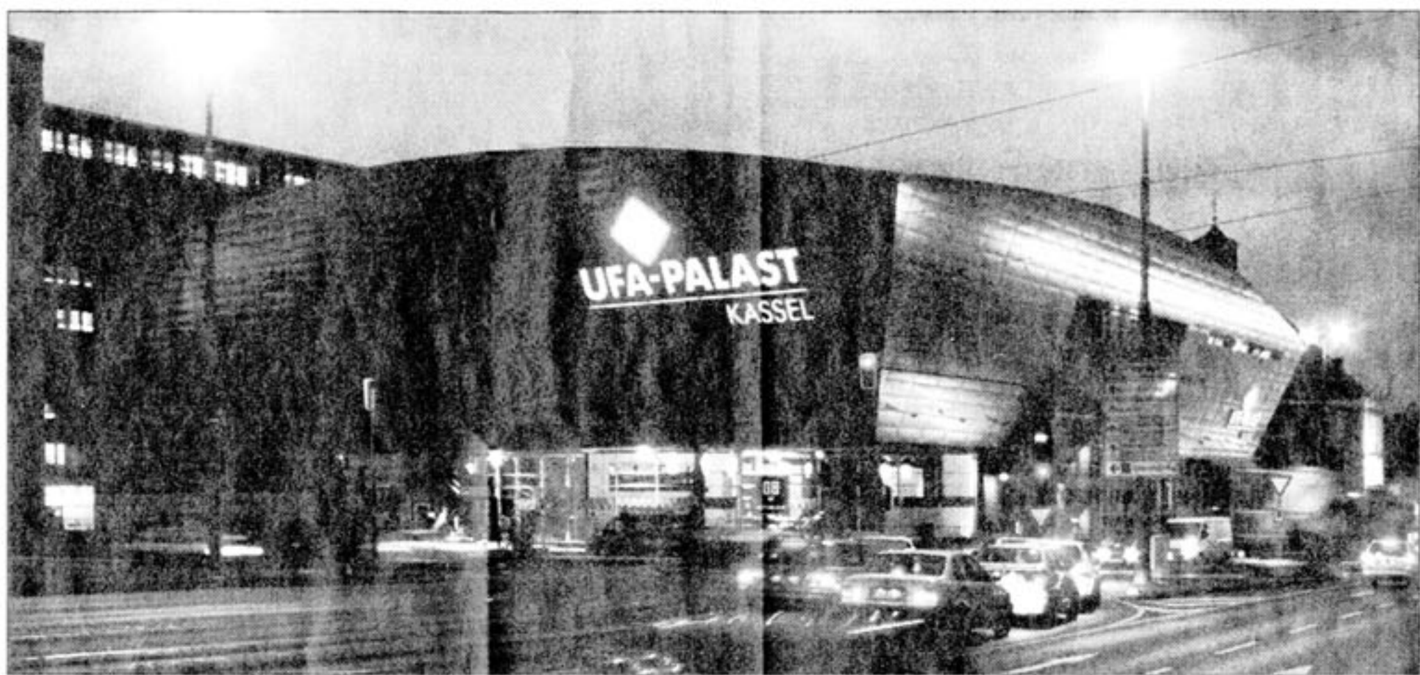
Neuer baulicher Akzent an der Trompete: Kassels größtes Kino: der UFA-Palast

Verwirklicht wurden auch Behindertenplätze, entsprechende Sanitäreinrichtungen sowie technische Hilfen für Hörgeschädigte. Für den Zugang an der Ecke Karlsplatz/Obere Karlsstraße wird - bedingt durch das Gefälle des Geländes - ein Aufzug zur Verfügung stehen.