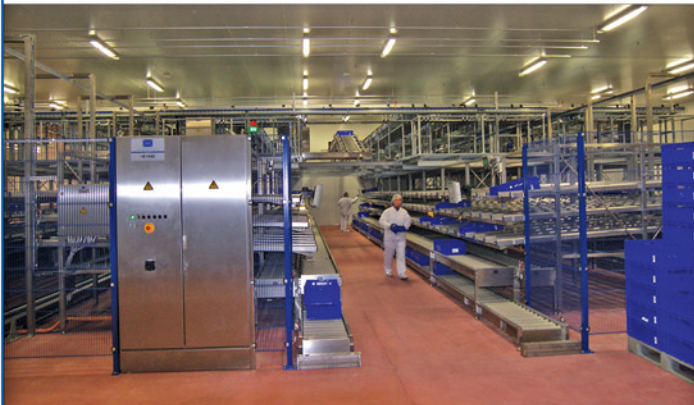
Fertigstellung Fleischlager – Innenansicht