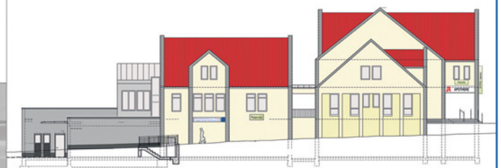
Ansicht von Südost