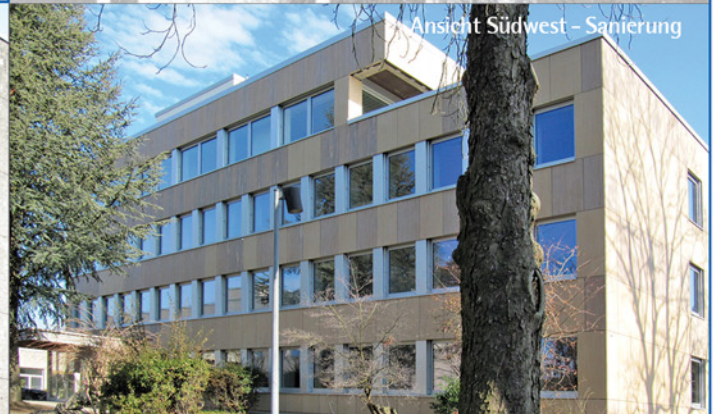
Ansicht Südwest - Sanierung