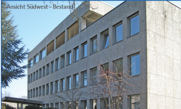
Ansicht Südwest - Bestand