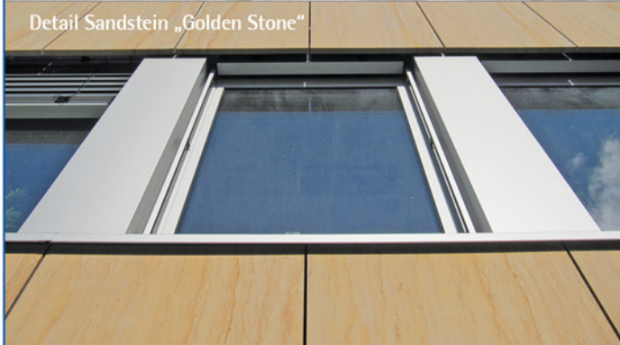
Detail Sandstein „Golden Stone“