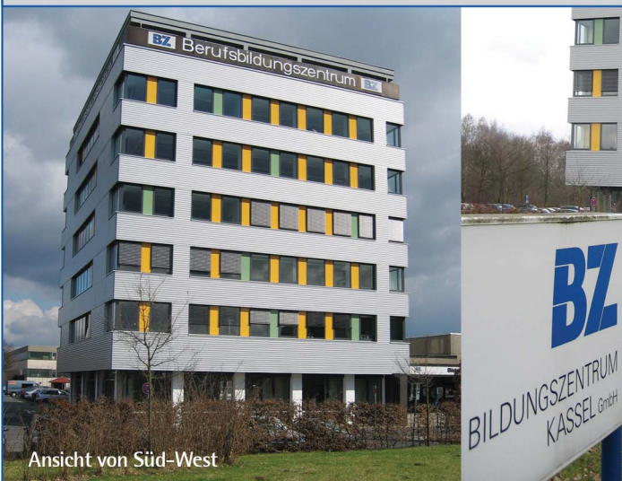
Ansicht von Süd-West