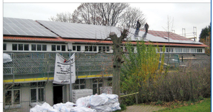
Installation von Photovoltaik