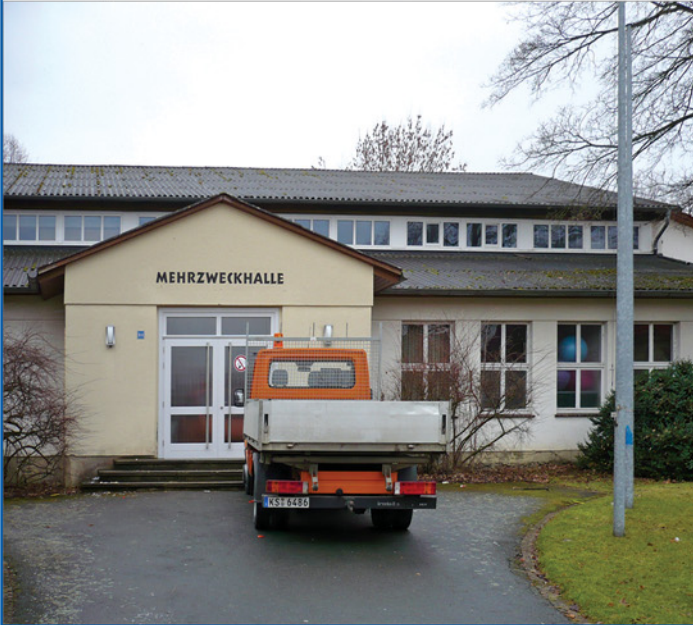
Eingangsbereich Mehrzweckhalle - Vor der Sanierung