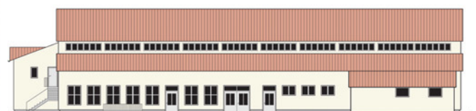
Ansicht von Süden