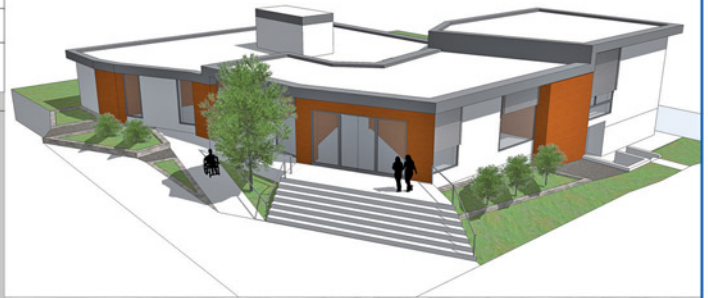
Perspektive von Nordwest - Aufsicht Grundriss Erdgeschoss