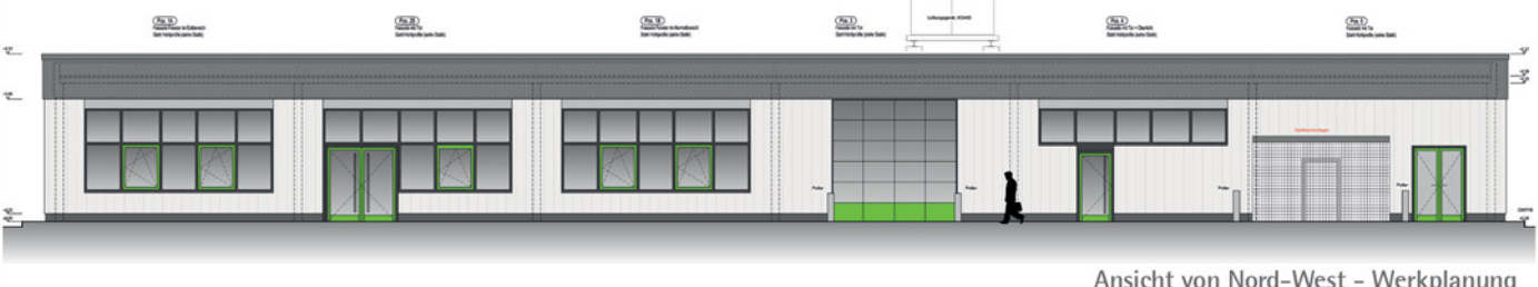
Ansicht von Nord-West - Werkplanung