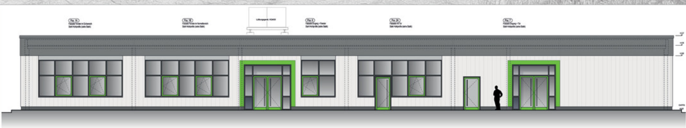
Ansicht von Süd-Ost - Werkplanung