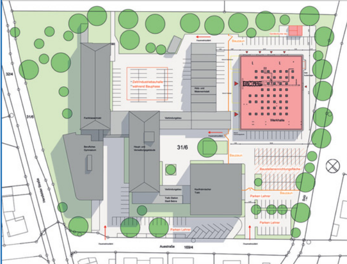
Freiflächen- / Baustelleneinrichtungsplan