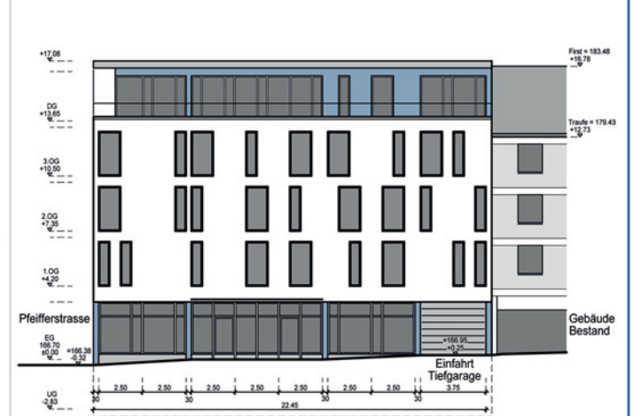
Ansicht von Norden - Farbvariante