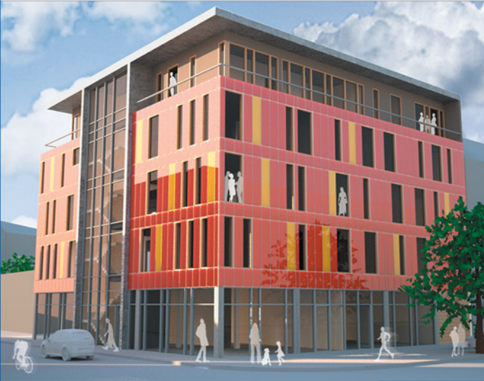
Perspektive Nordost - Glasfassade