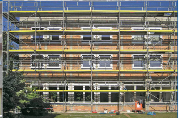
Altgebäude eingerüstet nach Rückbau der Werksteinfassade