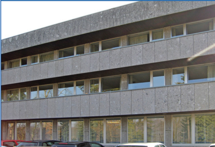
Teilansicht Seminargebäude - Bestandsfassade