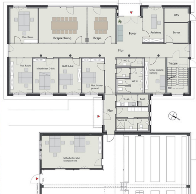
Grundriss Erdgeschoss – Verwaltung