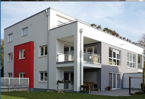
Schachtenstr. 20 - Ansicht Süd-West