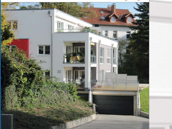
Schachtenstr. 22 - Ansicht West mit Tiefgarage