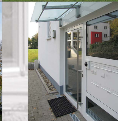
Detail Eingang Nr. 20