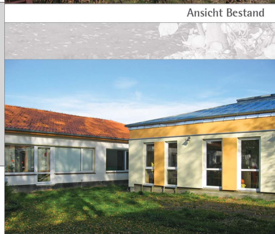
Ansicht Bestand mit Erweiterung