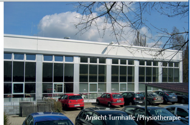
Ansicht Turnhalle / Physiotherapie