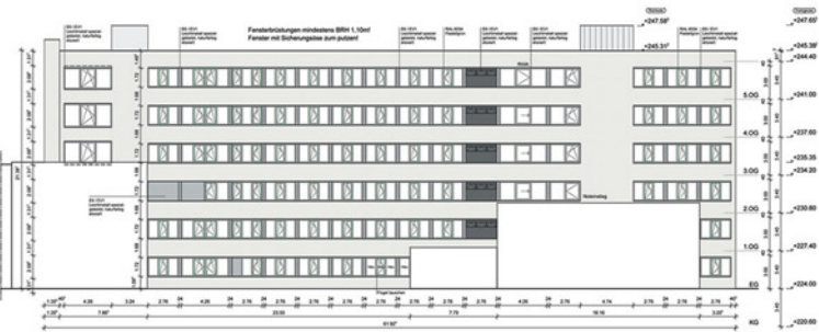
Ansicht von Norden

Energetische Sanierung der Fassaden des Bettenhauses einschließlich Turnhalle und Physiotherapie Bauherr Bau-/Sanierungsjahr Fassadenfläche Baukosten/Netto Vitos Orthopädische Klinik Kassel gGmbH 1965 / 2006–2007 3.330 m 2 1,14 Mio. €