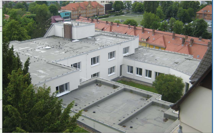
Kleiner Innenhof - Nach der Sanierung