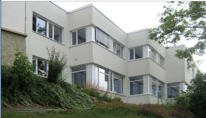
Fassade nach abgeschlossener Sanierung